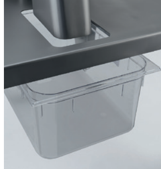
Table sur roulettes en acier inoxydable pour machines Tavolo in acciaio inossidabile su rotelle Stainless steel machine table on castors